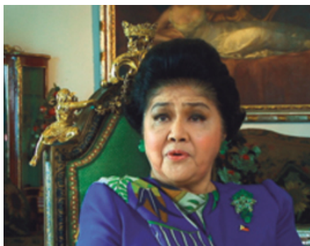
Despot Housewives produit par Day for Nightsur Planete+ à partir du 20 septembre