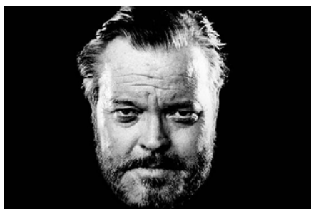
Orson Welles Autopsie d'une Légende , produit par la Cie des Phares et Balises sur Arte

Toujours en ligne, l'étude sur e-MEDIA et vos habitudes en matière d'informations sur la culture et l'Europe : http://urlz.fr/2q57