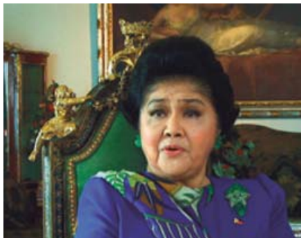
Despot Housewives produit par Day for Night sur Planete+